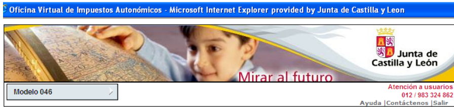
Imagen del formulario 046:

Oficina Virtual de Impuestos Autonómicos